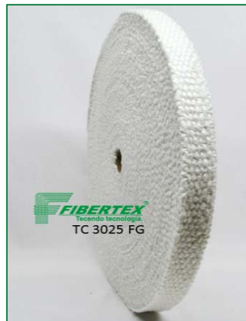
TC 3025 FG Espessura: 3,00 mm Largura: 25 mm Comprimento do Rolo: 30 m