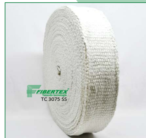
TC 3075 SS Espessura: 3,00 mm Largura: 75 mm Comprimento do Rolo: 30 m