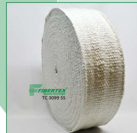
TC 3099 SS Espessura: 3,00 mm Largura: 100 mm Comprimento do Rolo: 30 m