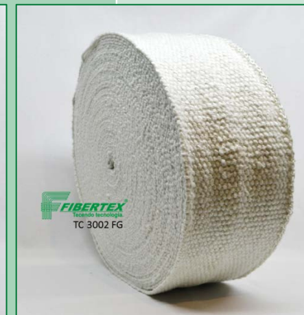
TC 3002 FG Espessura: 3,00 mm Largura: 200 mm Comprimento do Rolo: 30 m