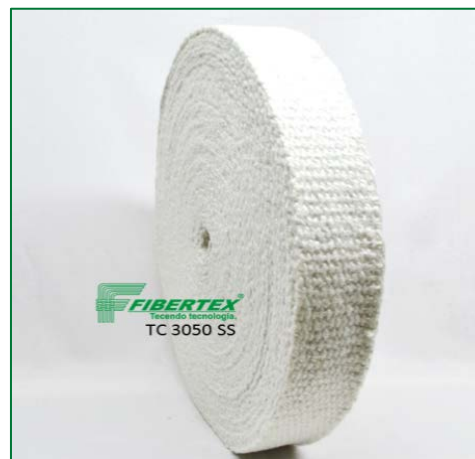
TC 3050 SS Espessura: 3,00 mm Largura: 50 mm Comprimento do Rolo: 30 m