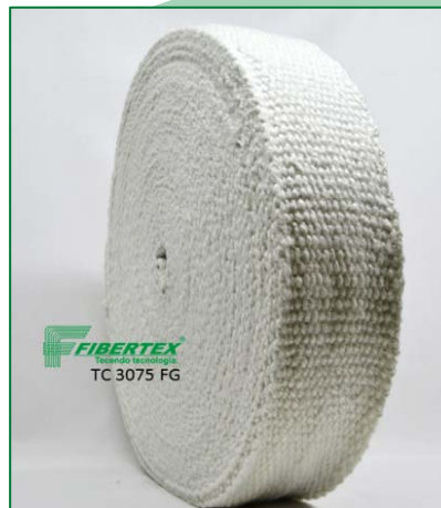
TC 3075 FG Espessura: 3,00 mm Largura: 75 mm Comprimento do Rolo: 30 m