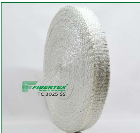
TC 3025 SS Espessura: 3,00 mm Largura: 25 mm Comprimento do Rolo: 30 m