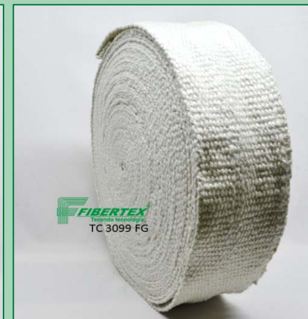
TC 3099 FG Espessura: 3,00 mm Largura: 100 mm Comprimento do Rolo: 30 m